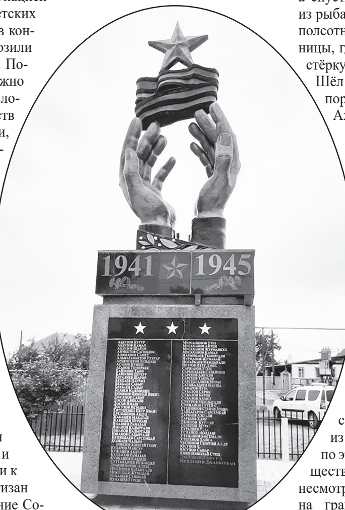
Памятник павшим воинам в ВОВ с.Бирючки. Астраханской области, открытый 8 мая 2010 году на родине Субаловых.