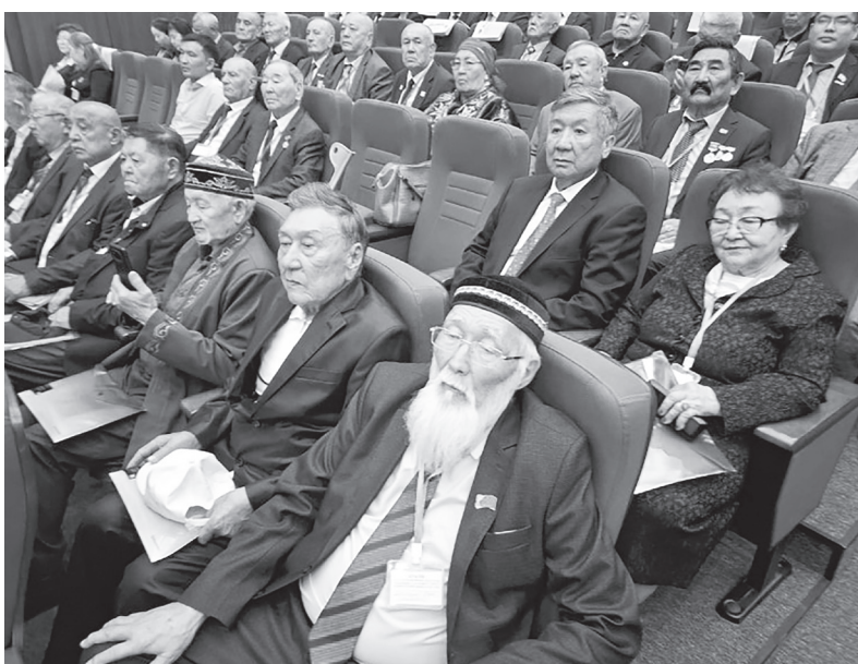
СИҚЫМБЕКТИҢ Алтынбайы. Іле ауданы.

Бұл жолдың тарих бетінен өшпейтіні анық болса, сол тарихты қолмен жасаған, келешекте жасай беретін ардагерлер еңбегі де ұмытыл-