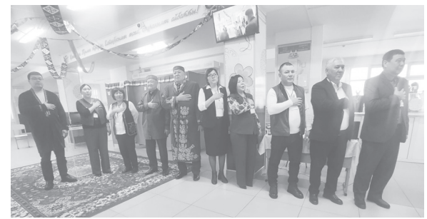
Қарасай ауданының ардагерлері учаскелік референдумда дауыс беруде.